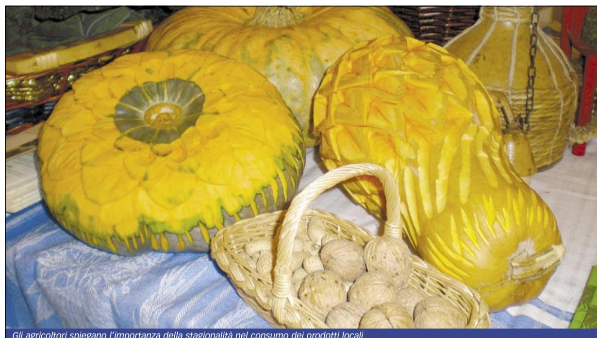
Gli agricoltori spiegano l'importanza della stagionalità nel consumo dei prodotti locali