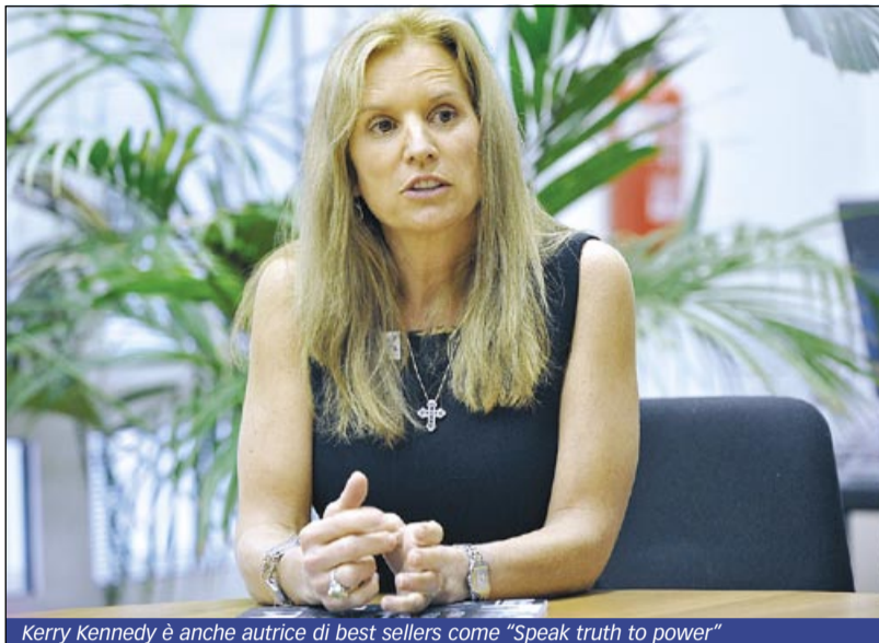
Kerry Kennedy è anche autrice di best sellers come "Speak truth to power"

Kennedy è passata poi a illustrare il progetto "Speak truth to power" ("Di la verità al potere", conosciuto in Italia come Coraggio senza confini), che ha ottenuto l'alto patronato della Repubblica Italiana. Il progetto è portato avanti dalla Robert F. Kennedy Foundation of Europe, che ha sede in Italia, ed è rivolto agli studenti delle scuole superiori di ogni provincia italiana. Talmente capillare è la diffusione di questa iniziativa di educazione al rispetto dei diritti umani, che 500.000 studenti nel nostro Paese, ben uno su tre, ne vengono raggiunti.