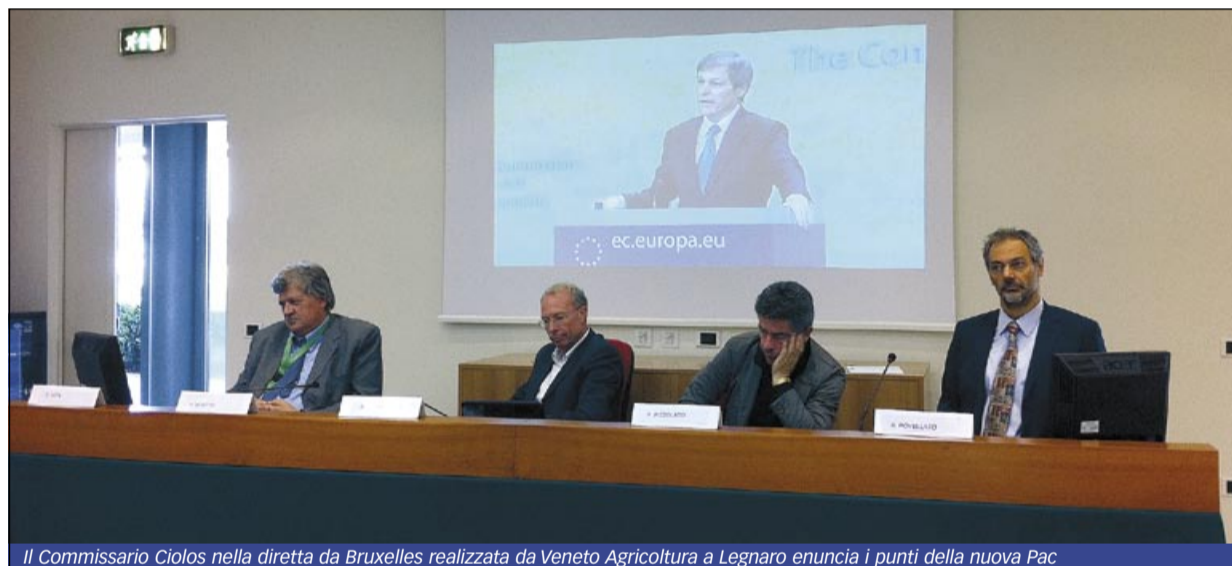
Il Commissario Ciolos nella diretta da Bruxelles realizzata da Veneto Agricoltura a Legnaro enuncia i punti della nuova Pac

Le nuove norme influenzeranno il destino del settore primario a partire dal 2014 fino al 2020: fino alla primavera del 2013 resterà infatti in vigore la Pac attuale, prima di arrivare al fatidico 2014 c'è circa un anno e mezzo di tempo per negoziare il progetto, con suggerimenti, critiche, correzioni che i Paesi membri potranno avanzare. E nel lungo negoziato questa volta anche il Parlamento europeo giocherà la sua partita con la cosiddetta "codecisione", alla pari degli Stati membri.